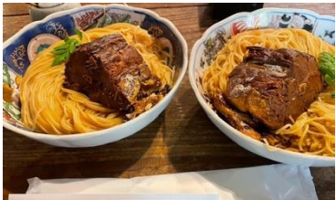
長浜名物【鯖そうめん】