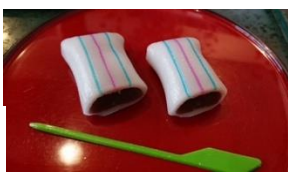
【糸切餅】 蒙古襲来に云われを持つ多賀名物