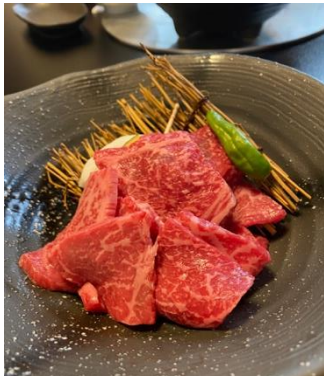
【近江牛】 鉄板焼きやすき焼きで！