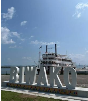
【琵琶湖】 (上) 「びわ湖テラス」 ロープウェイで行く標高1100mからの眺望 (下) 周遊船でクルージング