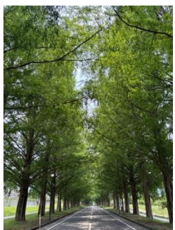
「マキノピックランド」の メタセコイア並木