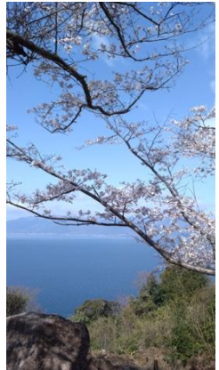
桜の名所海津大崎からの眺望